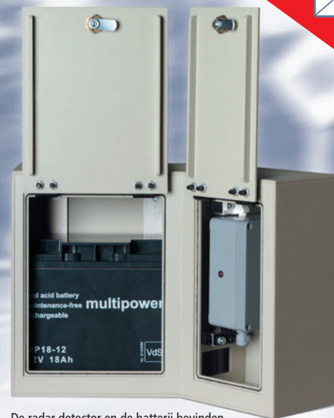
De radar detector en de batterij bevinden zich achter 2 afsluitbare deurtjes.