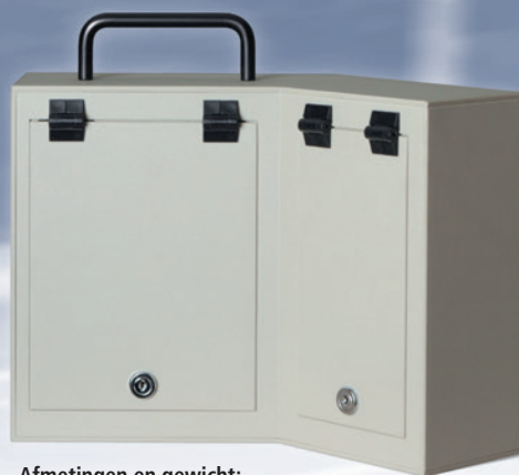
Afmetingen en gewicht: 37x26x23 cm (BxHxD), ca. 3 kg