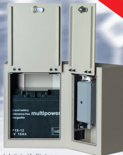
La batterie et le détecteur se trouvent sous le clapet.