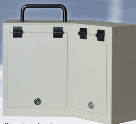
Dimensions et poids: 37x26x23 cm (LxHxl), ca. 3 kg