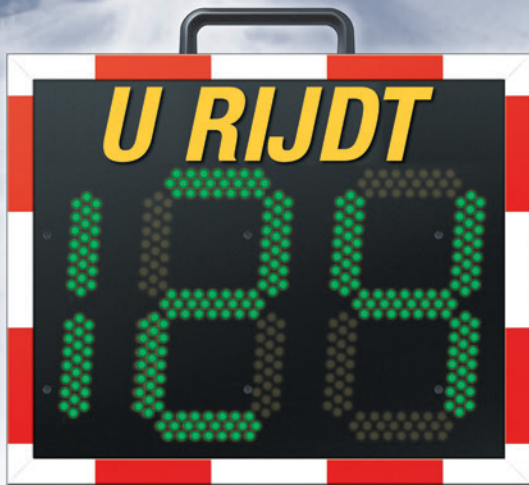
Afmetingen: 63x55x18cm (BxHxD)