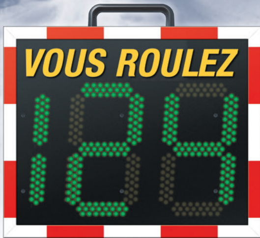
Dimensions: 63x55x18cm (LxHxl)