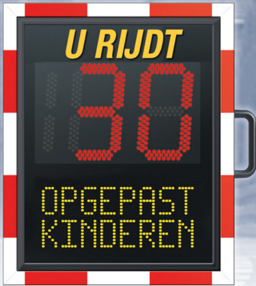
Afmetingen: 63x84x18cm (BxHxD)