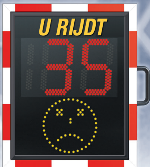
Afmetingen: 63x84x18cm (BxHxD)