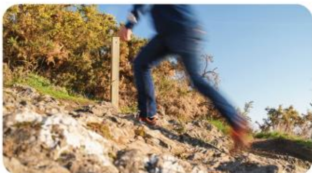
Le Poteau EVO Nature sous forme de poteau bois comptant les piétons et cyclistes sur un chemin de randonnée. Installé dans la nature il se fond dans le paysage. Le poteau bois comprend le dernier éco-compteur de personnes PYRO EVO .