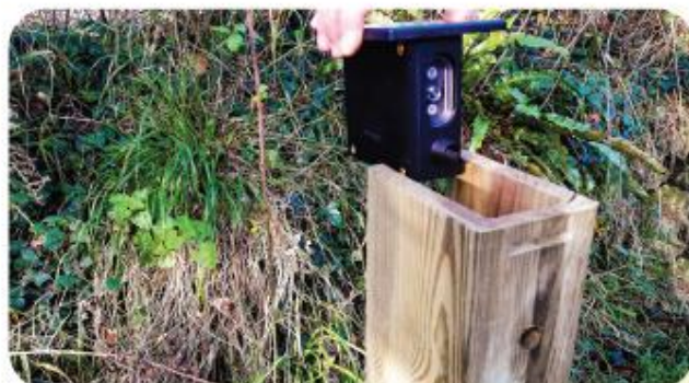
Le Poteau EVO Nature est un système facile à utiliser, qui nécessite peu de maintenance (autonomie 2 ans) et aucun déplacement sur site pour la maintenance et la relève des données (si télétransmission activée).